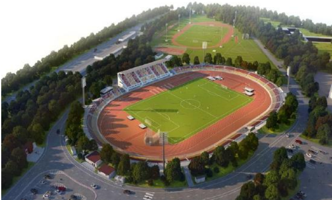
Stade de compétition (au premier plan) et stade d'échauffement (à l'arrière-plan)