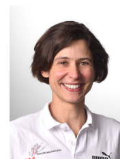
Carmen Balmer Medien