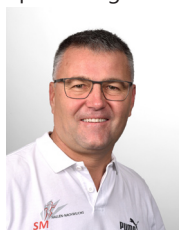
Martin Kaiser Rechnungsbüro