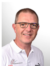
Daniel von Arb Catering