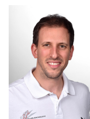
Claudio Flück Logistik