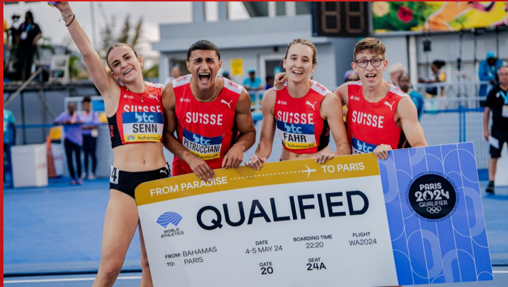
Delegationen: World Relays (Bahamas)