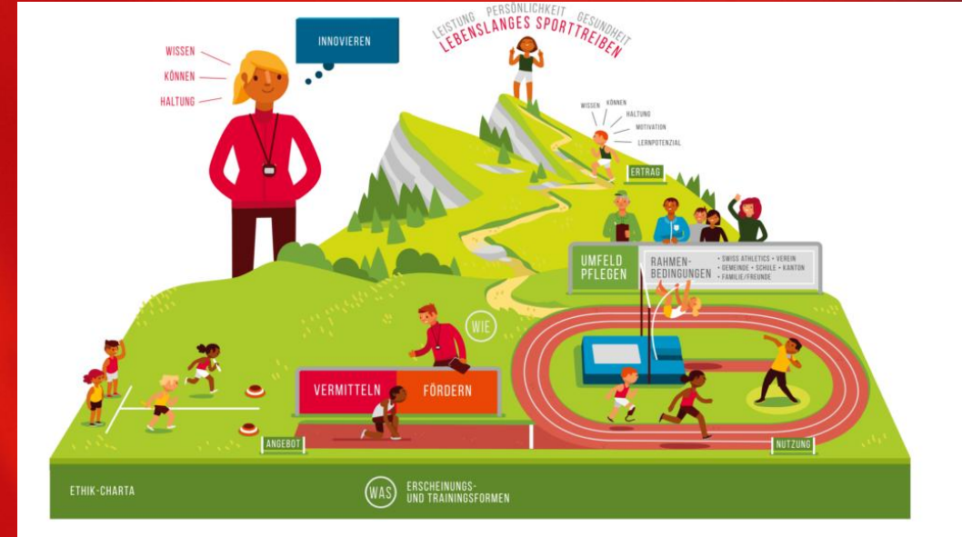
Ausbildung: Transfer der Aufgaben von BASPO zu Swiss Athletics